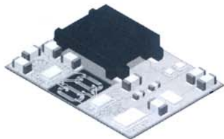
图3 隔离器Module技术内部结构

对过载用电流限制断路器为电源提供保护。通过I 2 C/SMBus接口访问两个电压输入和用隔离式10位ADC测量的负载电流值，从而实现了对高压总线的功率、能量和热量的监视。