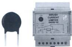
图1 浪涌控制限制器。(a)负温度系数(NTC)热敏电阻器；(b)阶跃启动继电器

正如已经看到的那样，控制、保护和监视高压DC电源需要将很多组件拼凑到一起，并让这些组件安全和无缝地运行。这不是微不足道的任务。这类分立式解决方案尺寸大、组件密集、价格昂贵而且缺乏安全认证。人们需要一种集成式和经过认证的解决方案，以将设计时间和认证工作从几个月缩短到几周时间。