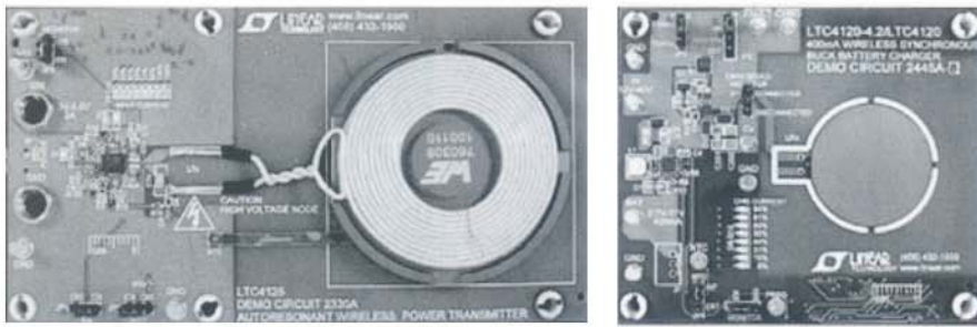
图2 实现无线电池充电的 LTC4125 和 LTC4120 演示电路