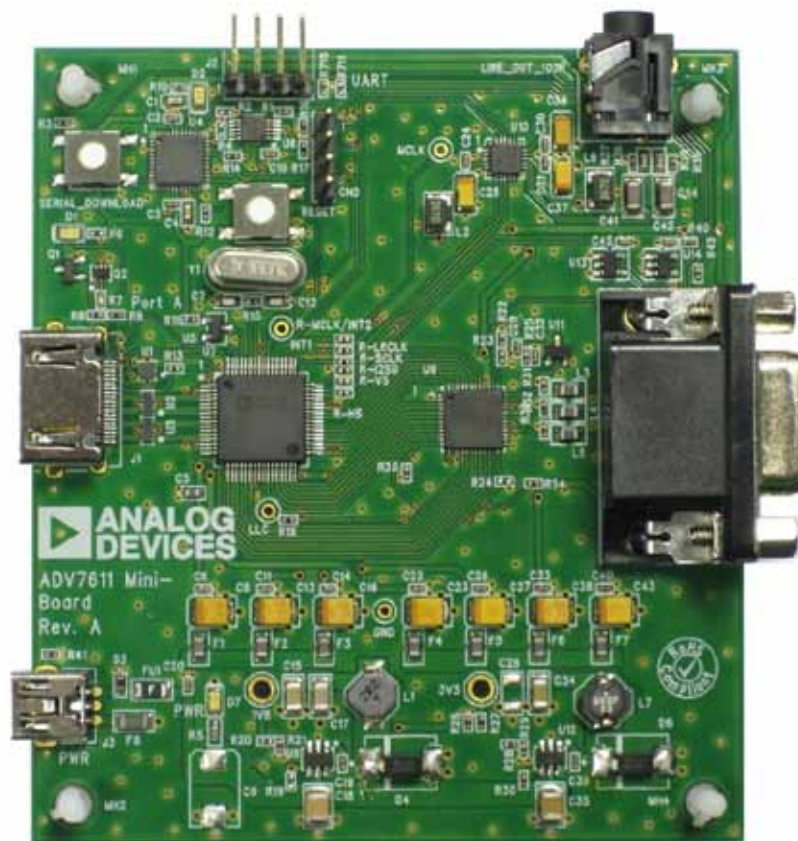
图2. 带音频提取的HDMI至VGA (HDMI2VGA)转换器，2层PCB

提供设置像素总线驱动器以及音频输出的驱动强度的选项，可用来降低EMI/RFI辐射的影响。在ADV7611内部完成驱动强度的降低工作。更多信息，请参考UG-180用户指南的“驱动强度选择”部分。